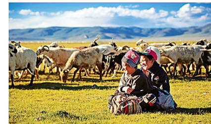
人与动物和谐共生

人与动物和谐共生，也源于阿里人一生都保持着质朴纯真的模样，这或许是辽阔的大地所赋予他们的纯粹生活态度，他们用最原始单纯的样子，敬畏自然、尊重自然、热爱自然，实实在在地融入大自然的怀抱，去奉献回馈这片土地。