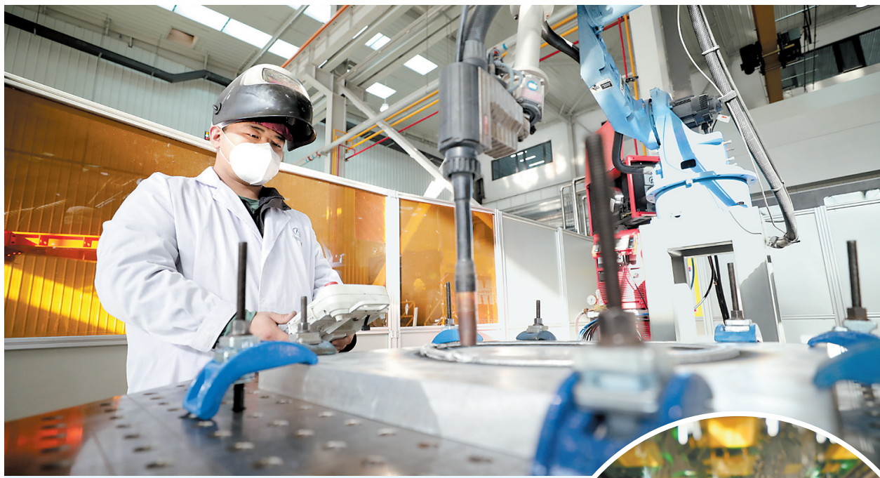
▲日前,在首都航天机械有限公司廊坊增材制造分公司生产车间内,工人正在运用机器生产3D打印产品。该公司致力于航天特种结构增材制造技术的研发、应用。目前已累计实现20多个型号、2000余件航天产品的研制,确保了我国多个航天重大工程的交付和首飞。

连续两年,廊坊市政府将县域科技创新能力跃升计划写入《政府工作报告》,明确提出2020年消除C类