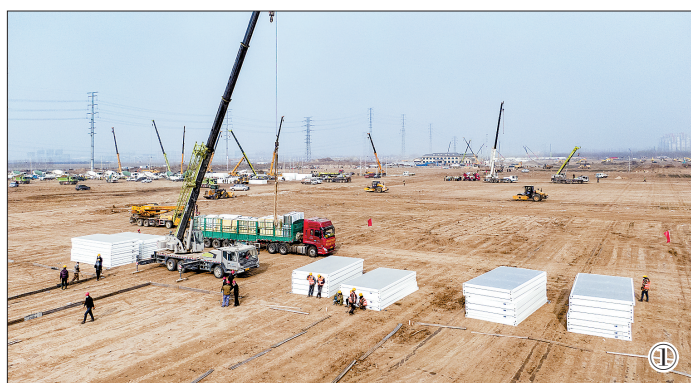
1月13日,位于正定县与藁城区交界处的黄庄公寓隔离场所建设全面展开。短短几天时间,滹沱河岸边的这片空地变了模样。图①摄于1月14日11时23分;图②摄于1月15日18时08分;图③摄于1月16日16时32分。