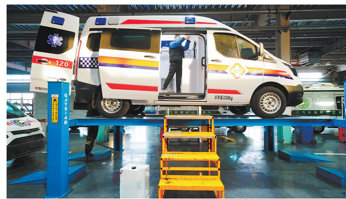
近日,唐山亚特专用汽车有限公司紧急赶工的10台负压式救护车下线即驶上抗疫一线。负压式救护车在救治和转运传染病等特殊疾病患者时,可以最大限度地降低医务人员交叉感染的概率。这是该公司技术人员在安装负压式救护车内的照明灯具。

区疫情防控总指挥部、1个办公室和16个分指挥部,细化工作职责,明确责任分工;加强督导检查,确保各项防控措施落地落实见效。“4”是刚性落实四项举措,坚持最严排查“清存量”,场所管控“减流量”,把牢人口“控增量”,分类防控“防变量”,认真对重点人群和部位开展地毯式滚动排查,对农村和社区层层设卡管控,对各行各业实行分类动态管理,进一步织密防控病源输入的保护网。“5”是坚决守住“五道防线”,严格核查流程,坚决守住“外围防线”;实施设卡管控,坚决守住“村居防线”;严格冷链检查,坚决守住外输防线;每日组织巡查,坚决守住企业防线;设立举报电话,坚决守住监督防线。