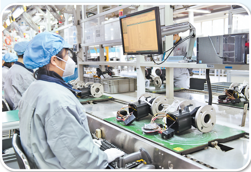
▲日前,汇中仪表股份有限公司的员工在智能装配线组装大口径超声波表。