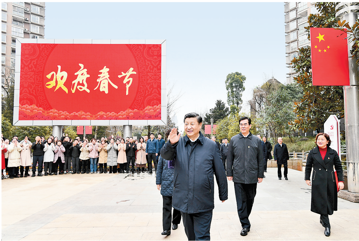
2月3日至5日,中共中央总书记、国家主席、中央军委主席习近平来到贵州考察调研,看望慰问各族干部群众,向全国各族人民致以美好的新春祝福。这是4日下午,习近平在贵阳市观山湖区金阳街道金元社区广场,向居民们挥手致意。

观山湖区金阳街道金元社区以党建为引领,积极推行党建网、平安网、民生网“三网融合”,提升了基层治理能力