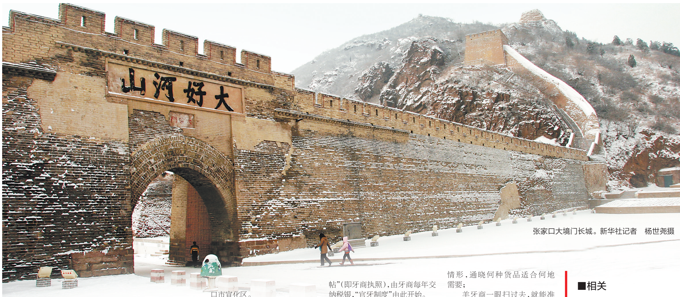
张家口大境门长城。