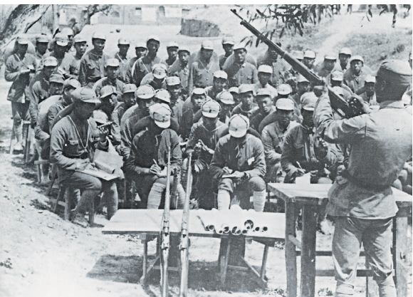
抗大学员学习步枪操作