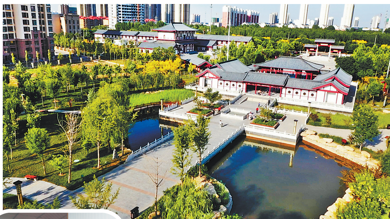
▲近年来,衡水市桃城区结合省级文明城区创建工作,大力推进公园游园建设,使市民幸福感明显提升。桃城区孔颖达文化公园,是市民休闲锻炼的好去处。

政府有形之手、市场无形之手、市民勤劳之手同向发力,一项项便民之举、利民之策开始实施,城市的有形颜值和无形气质都发生了巨大变化,文明成为惠民利民的暖流浸润至衡水城乡居民心间。