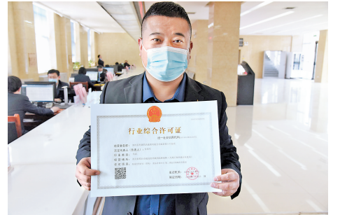
3月7日，市场主体负责人展示全省第一张“一业一证一码”行业综合许可证。

河北日报讯(记者王永晨 通讯员赵国华)3月7日，在威县“十四五”期间全面深化改革启动仪式暨“一业一证一码”首发仪式上，威县行政审批局向清河利康药店连锁有限公司威县第十六分店颁发全省第一张“一业一证一码”行业综合许可证。据了解，这张行业综合许可证涵盖了药品经营许可证、第二类医疗器械经营备案、食品经营许可证等证件，使企业办证时间由1个多月压缩至2个工作日，到现场勘验次数由3次压缩为1次，大幅降低了市场主体制度化交易成本。