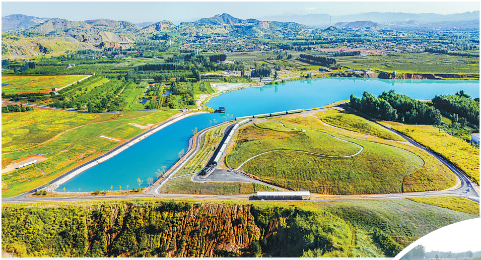
▲昔日的迁安市金岭铁矿矿坑,今现碧水花海。 ▶保定市涞水县富位村村民正在整理好的耕地上播种。

全省聚焦“三件大事”和乡村振兴,精准有效做好资源要素保障,服务全省经济社会发展。一是继续做好雄安新区用地报批工作,加快推进新区建设用地供应,保障重点片区和新区建设项目顺利实施。二是坚持土地要素跟着项目走,以真实有效的项目落地作为配置计划依据,并做好国土空间规划批准实施前过渡期的规划实施管理,全力保障国家和省重大项目、京津产业转移项目、省市重点项目用地需求。三是助力乡村振兴战略实施,积极争取增减挂钩指标跨省调剂任务,继续支持脱贫地区增减挂钩和补充耕地指标调剂流转,做好农村一二三产业融合发展用地工作,合理保障农村三产新业态发展和农村村民住宅建设用地需求。加快推进易地扶贫搬迁安置房项目手续完善和不动产登记。做好今年的土地要素保障工作,还要适应贯彻落实新《土地管理