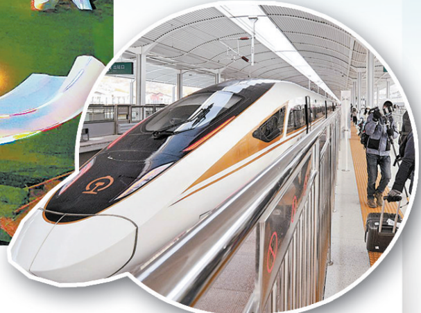
旅客乘坐京张高铁抵达太子城车站。(新华社资料片)