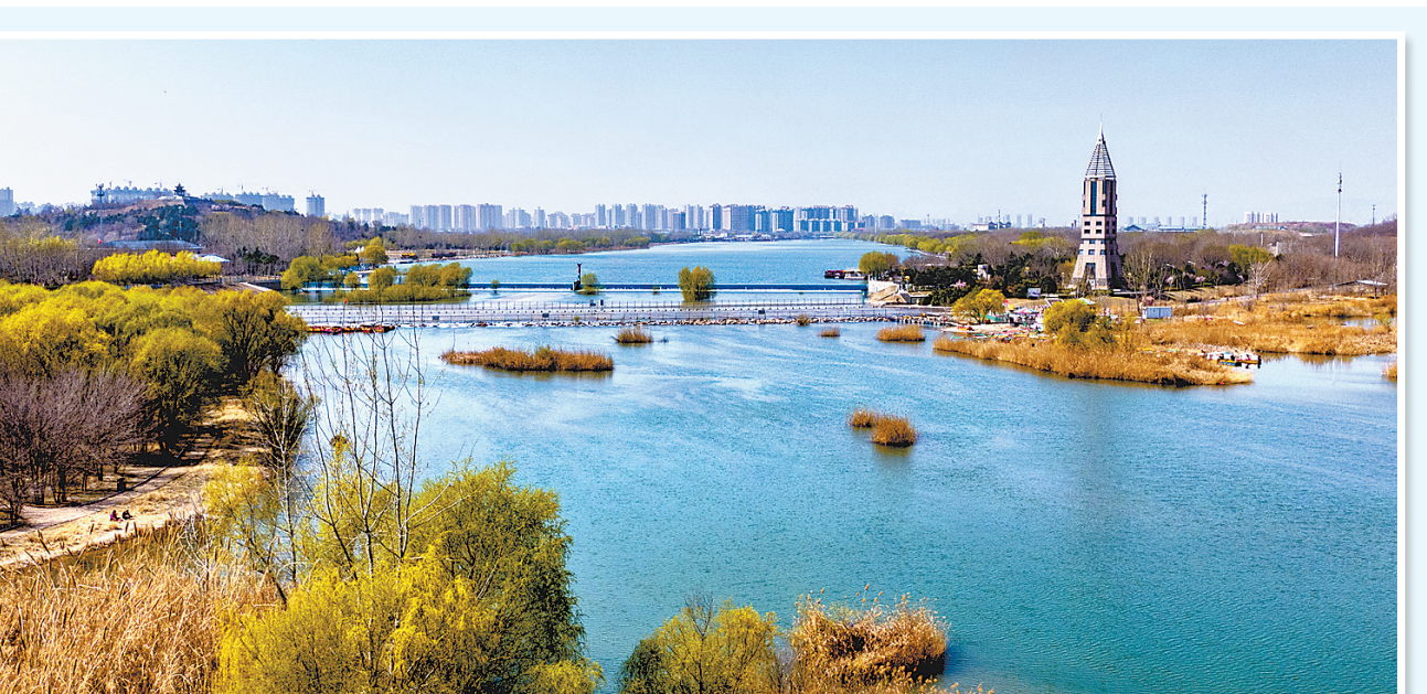
近日,石家庄市城市水系园林中心协调上游水源管理部门,经太平河东段渠道为滹沱河补水,通过橡胶坝调节置换太平河水体,为石家庄太平河水系打造最景观效果。