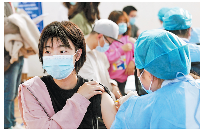
3月28日,在华东师范大学闵行校区体育馆内,学生在接种新冠疫苗。目前,上海正在稳妥有序推进各高校师生员工的新疫苗接种工作。

“根据国家的总体部署和安排,各地按照应接尽接、梯次推进、突出重点、保障安全的原則,做好重点地区和重点行业人群的接种工作,集中力量在疫情发生风险高的大中型城市、口岸城市、边境地区开展接种。”吴良有介绍,将先期安排机关企事业单位人员、高等院校学生及教职工、大型商超服务人员等人群接种疫苗,稳步推进60岁以上、慢性病人等人群接种,提高疫苗覆盖范围。