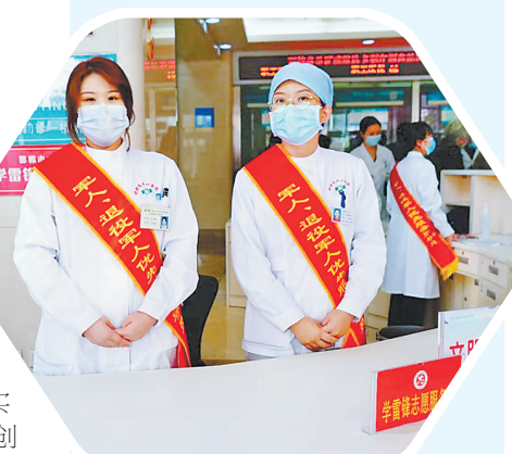
邯郸鼓励各级各类医疗机构加入拥军行列，通过组建专门医疗服务队，为现役军人家属提供预约、急诊、检查、住院等全程陪伴服务。

建立退役军人就业需求数据台账，全市确定226家退役军人就业基地及实习实训基地、29家退役军人教育培训基地，创办21个退役军人创业孵化基地、20个退役军人返乡创业园，举办线上线下退役军人专场招聘会等“组合拳”，促进了退役军人高质量创业就业。