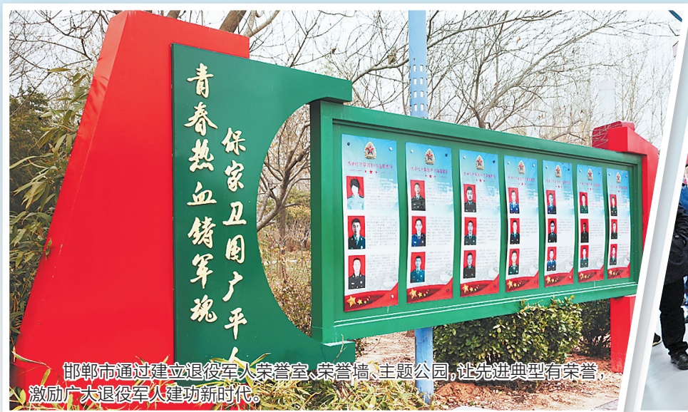
邯郸市通过建立退役军人荣誉室、荣誉墙、主题公园，让先进典型有荣誉，激励广大退役军人建功新时代。

进入新时代，双拥工作呈现新情况新特点，如何把党的十九大提出的“让军人成为全社会尊崇的职业”“推进军人荣誉体系建设”等要求落实落细，让军人军属、退役军人充分感受到社会的尊崇和关爱，邯郸市退役军人事务局在上级退役军人事务部门关心指导下，在市委、市政府领导下，创新理念，破解难题，通过社会化拥军、建立军人荣誉体系等探索，推动退役军人优抚工作从解困帮扶型向褒扬激励型转变，营造了关心国防、尊崇军人的浓厚氛围，有效提升了军人军属、退役军人的荣誉感、获得感。