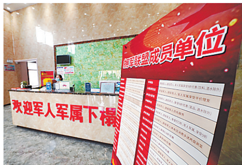
邯郸在全国率先创建拥军联盟，为军人军属、退役军人提供餐饮住宿、教育医疗、法律帮助、休闲购物等多领域优惠服务。

让拥军插上“智慧”的翅膀，2020年5月15日，由拥军联盟App、市县乡村四级退役军人微信矩阵和“邯郸退役军人事务局”微信公众号三个信息平台组成的邯郸“智慧拥军”平台正式启动。其中，拥军联盟App分类精细、操作简便、应用安全，把社会拥军志愿服务划分为生活消费、医疗健康、教育培训、法律援助、就业创业等5个大类21个小类，拥军企业基本信息、联络方式、服务承诺、服务评价等一目了然，使拥军服务体验更加便捷。