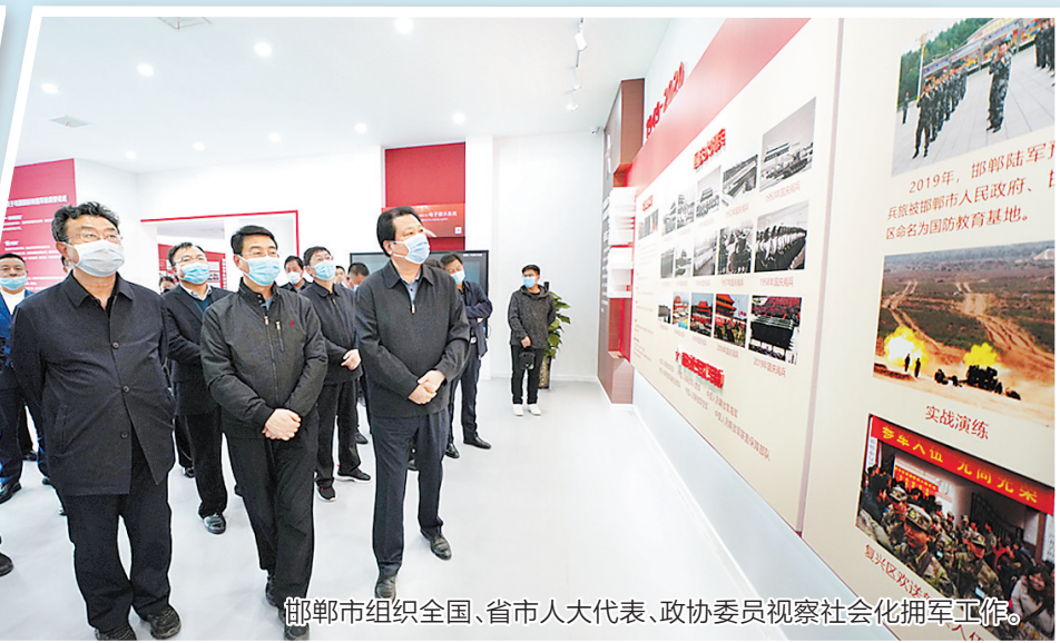
邯郸市组织全国、省市人大代表、政协委员视察社会化拥军工作。