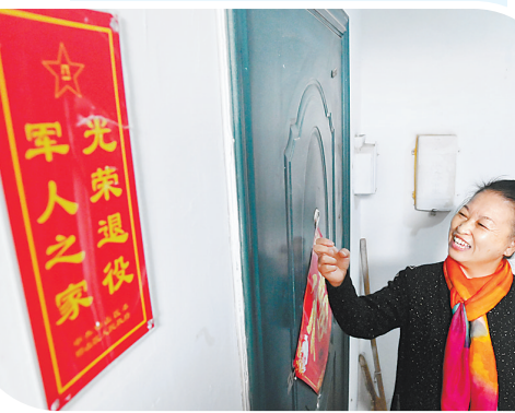
邯山区百乐苑社区退役军人服务站志愿者为社区高龄独居退役军人提供“幸福天天来敲门”服务。

两次参与击落敌机、“隐姓埋名”41年的老英雄韩泽民；“7·19”洪灾中勇救被困群众的基层干部高保刚……在邯郸广播电视台演播厅，邯郸优秀退役军人风采展示活动已连续举办两届，20名优秀退役军人动情讲述了他们在平凡岗位上不平凡的故事，军人作风、军人精神、军人信仰深深打动了现场观众。该市推选出的优秀退役军人李文章、曹振锋获“全国模范退役军人”荣誉称号，牛怀生、李延亮等9人获“全省优秀退役军人”荣誉称号，崔具平获河北省“最美退役军人”荣誉称号。