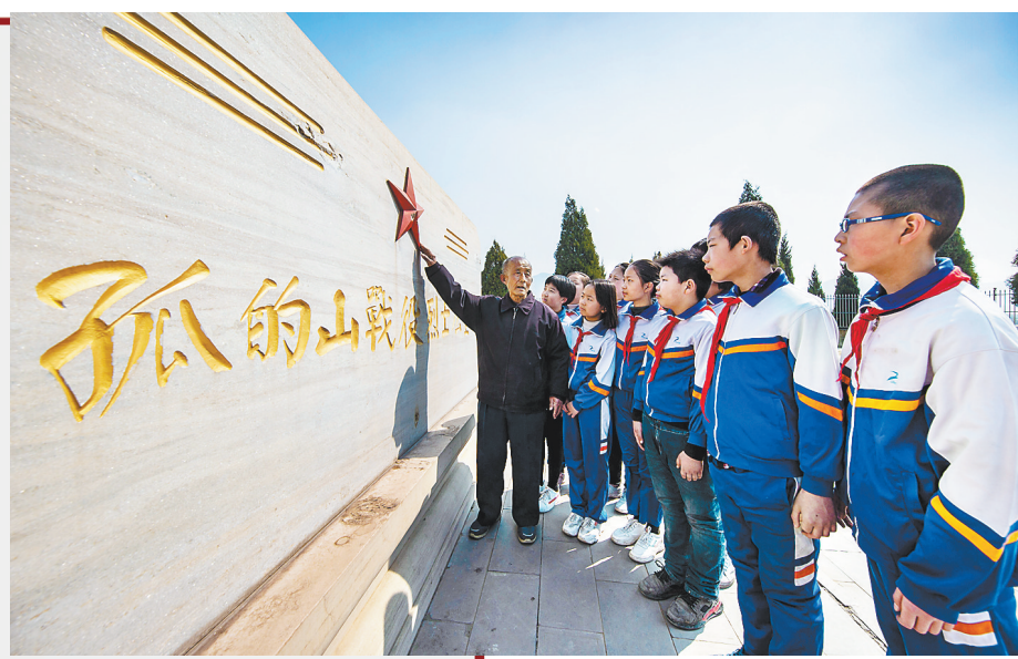
武安市的学生们在阳邑镇柏林村孤的山战役烈士公墓前，听讲解员讲述烈士抗战事迹。