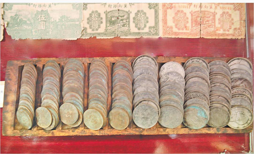
▼抗日战争时期，太行抗日根据地流通的冀钞和钱币。