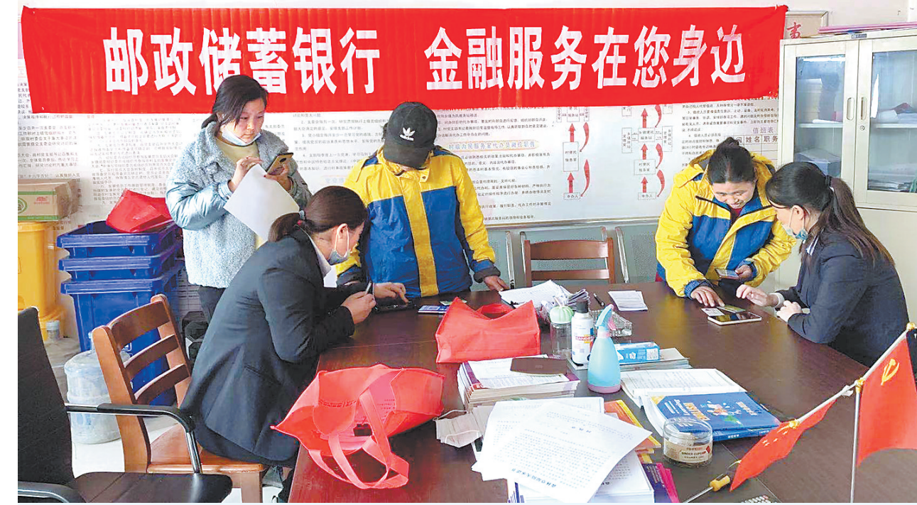
邮储银行保定分行曲阳县支行进村推进金融信贷服务宣讲和答疑。

不过,金融资源的区域间分配更多是由市场力量主导。要想消除金融机构的区域投资偏见,调动金融机构投资经济困难省份的积极性,需要依靠多方合力。除了需要金融机构提高政治站位、统一思想认识,还需要金融监管部门从丰富区域不良率容忍度差异化、细化监管考核激励机制等方面拿出实招;地方政府也需从优化营商环境方面着手,借鉴经济发达省份经验,切实深化“放管服”,并稳妥主动有序地化解潜在信用风险,为金融机构营造可信的投资环境。