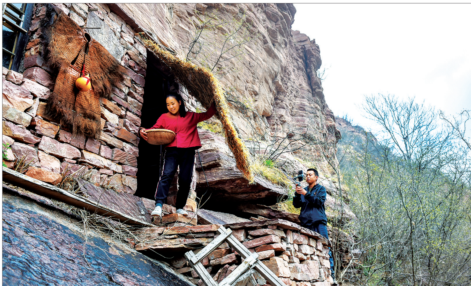
左图:小夫妻在山崖下的民宿小院拍摄。