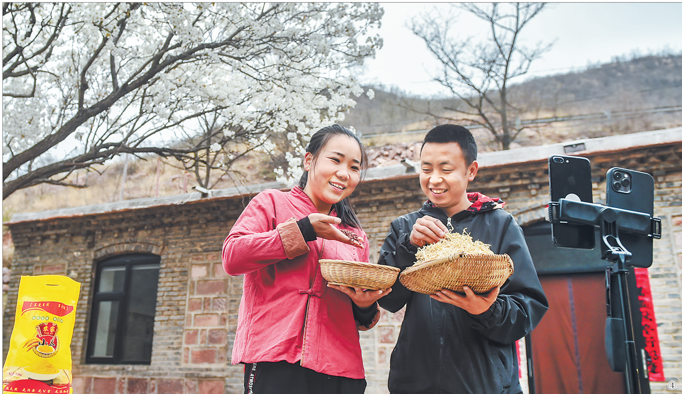
图④:4月2日,小夫妻在民宿小院里直播,推介老乡们的农产品。