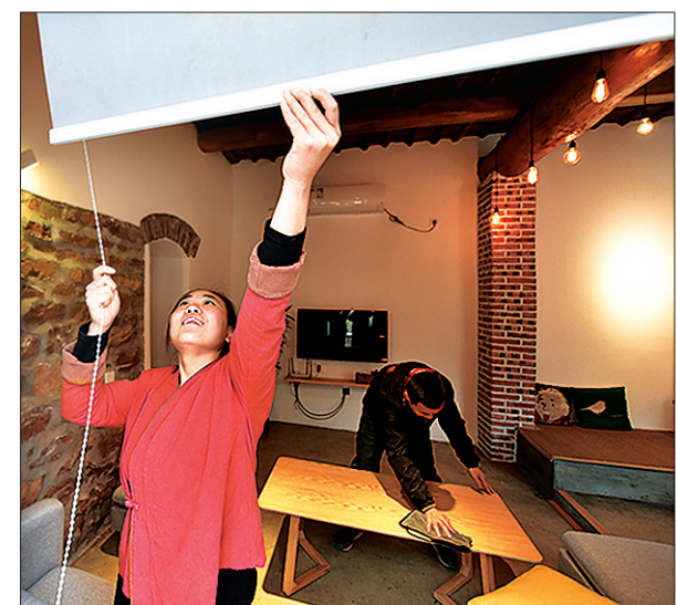
上图:小夫妻收拾打扫“伴山邀”的特色民宿,准备迎接游客到来。