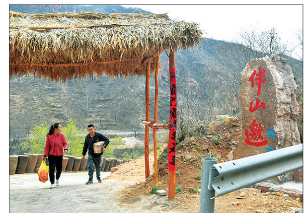
下图:小夫妻采购归来。