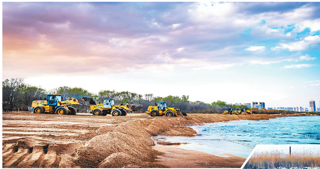
秦皇岛市金屋至浅水湾浴场侵蚀沙滩修复工程机械化施工现场。

在岸线岸滩整治修复中,我省坚持问题导向、因地制宜,准确识别生态损害原因,科学制定保护修复措施。坚持保护优先、自然恢复,秉持尊重自然、顺应自然理念,最大程度恢复生态系统功能。坚持系统修复、整体实施,海陆统筹、整体施策,切实提升生态修复综合成效。坚持动态监管、强化监测,建立健全保护维护长效机制,持续发挥生态保护修复效益。共整治修复岸线17.32公里,沙滩宽度增加20至60米,有效改善了沙滩侵蚀状态,减缓了海岸侵蚀后退和湿地退化趋势,增大了海洋和陆地之间的缓冲区域,提升了生态系统防灾减灾能力,维护了区域生态安全。