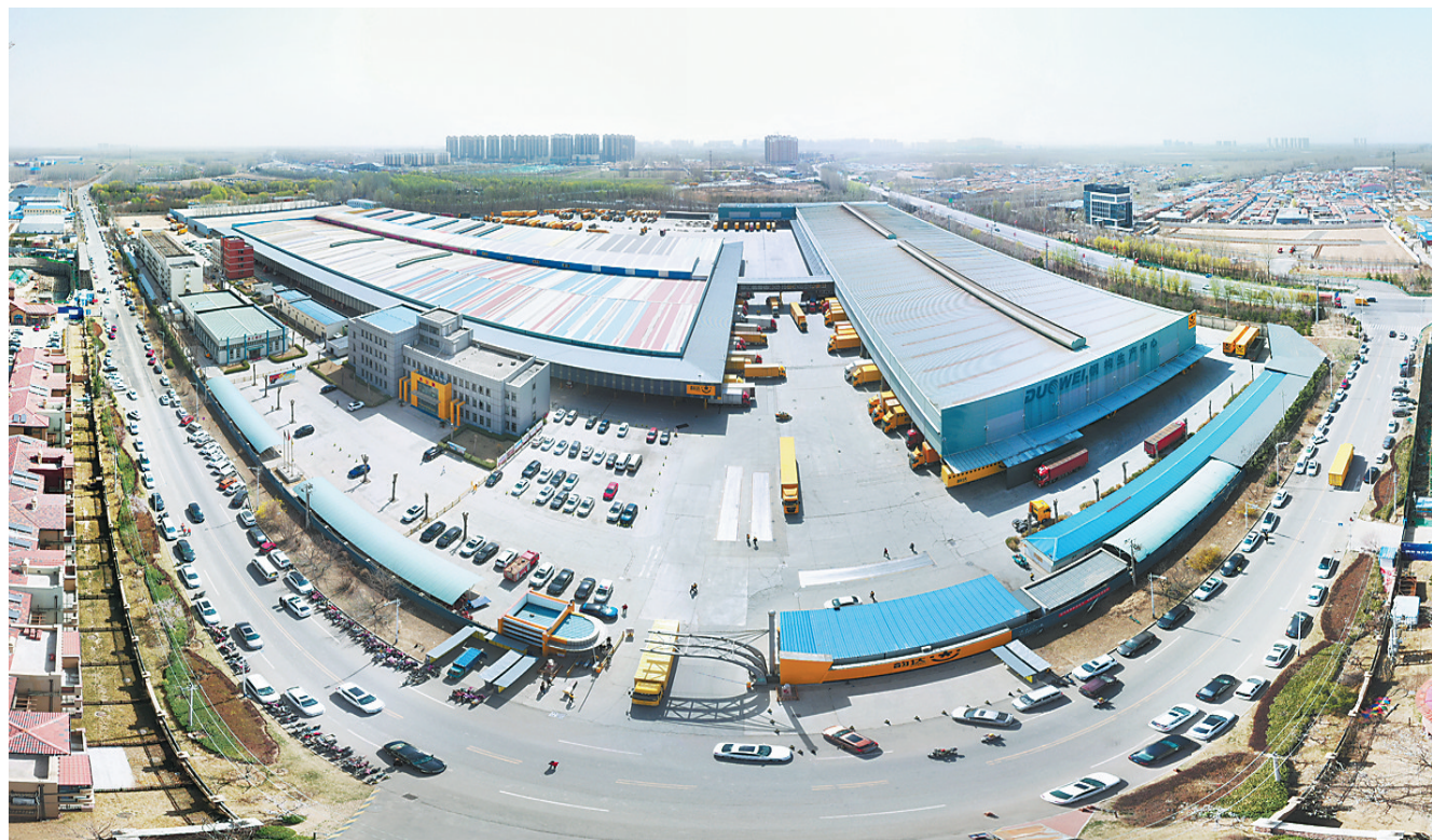
香河县韵达华北转运中心航拍图。

2020年,全市快递业务量完成4.64亿件,快递业务收入55.26亿元,均居全省第三位,同比分别增长70.57%和62.34%,分别高出全国增幅39.37个和45.04个百分点。先后引进了投资127亿元的京东云计算中心、投资24亿元的京东亚洲一号及跨境电商、投资60亿元的阿里巴巴菜鸟等国内商贸物流龙头企业落户,实施亿元以上现代商贸物流项目40个,总投资712亿元