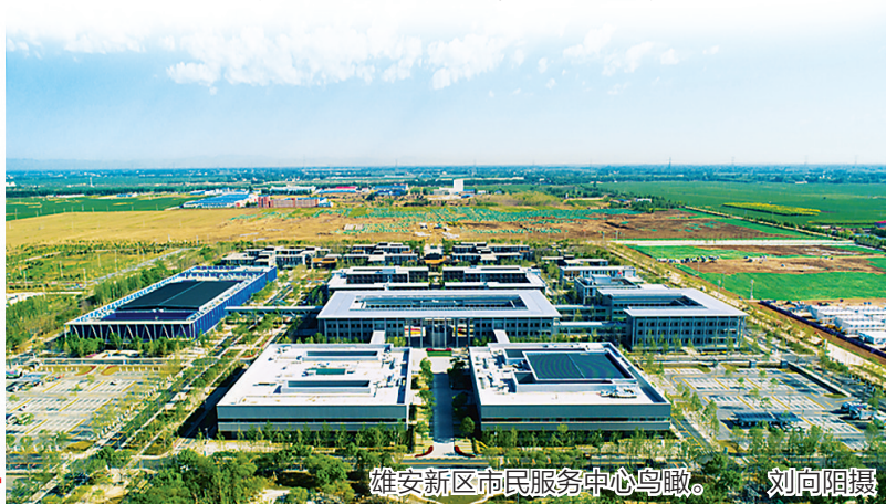
雄安新区市民服务中心鸟瞰。

国家跳台滑雪中心:2022年冬奥会张家口赛区的标志性场馆,因外形酷似中国传统饰物“如意”,故又称“雪如意”。它是全国首个跳台滑雪场地,是张家口赛区工程量最大、技术难度最高的竞赛场馆之一。