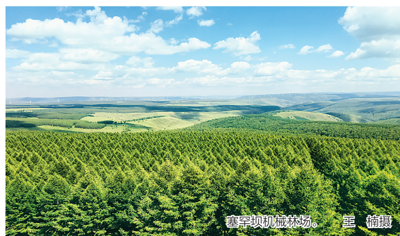
塞罕坝机械林场。