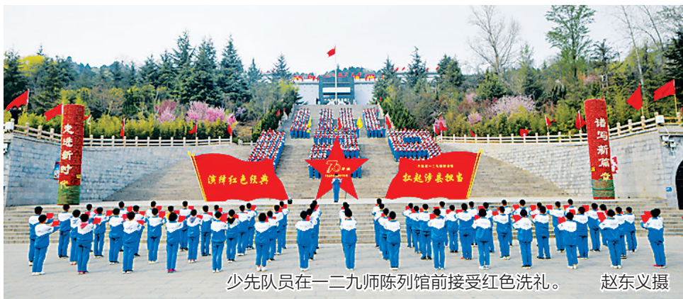
少先队员在一二九师陈列馆前接受红色洗礼。

线路1:红色太行山,大美红河谷 邯郸市晋冀鲁豫烈士陵园、武安市晋冀鲁豫中央局旧址、伯延古镇、涉县八路军一二九师司令部旧址、晋冀鲁豫边区政府旧址、山底村地道战遗址、中国人民抗日军政大学陈列馆等。 线路2:重温经典,致敬英雄 保定市阜平县晋察冀边区革命纪念馆、唐县白求恩柯棣华纪念馆、唐县晋察冀烈士陵园、易县狼牙山五勇士陈列馆、清苑区冉庄地道战遗址、高阳县高蠡暴动烈士陵园及纪念馆、雄安新区白洋淀雁翎队纪念馆、沧州市献县马本斋烈士陵园纪念馆等。 线路3:模范边区,抗战传奇 石家庄市华北军区烈士陵园、保定市阜平县城南庄晋察冀军区司令部旧址、晋察冀边区革命纪念馆、涞水县野三坡平西抗日根据地等。 线路4:众志成城,长城抗战 唐山市潘家峪惨案纪念馆、承德市宽城满族自治县王厂沟冀东抗战遗址、滦平县金山岭长城、张家口市大境门、保定市涞源县黄土岭斗