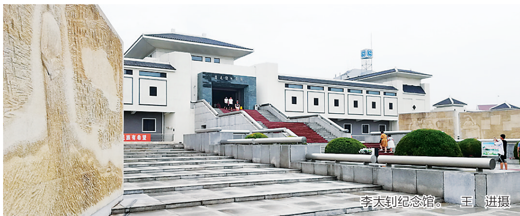
李大钊纪念馆。

全国第一个农村党支部纪念馆:位于衡水市安平县城台村,丰富的图片资料和实物,展示了全国第一个农村党支部创始人弓仲韬投身革命、矢志不渝的故事。