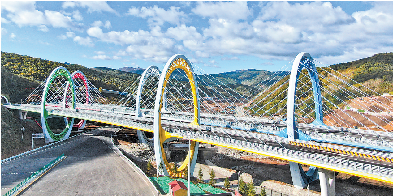
图为延崇高速河北段太子城互通主线一号桥。

北斗卫星信号在延崇高速实现全覆盖和综合利用,为高速公路插上“数字化翅膀”。杜贺军说,延崇高速沿线布设大量摄像头、雷达等路测感知设备,在全国率先开展了高速公路场景80公里时速L4级自动驾驶和基于蜂窝网络技术车路协同测试,不仅为自动驾驶汽车提供理想道路环境,依托“数字延崇”智慧管控平台,道路管理者还实时