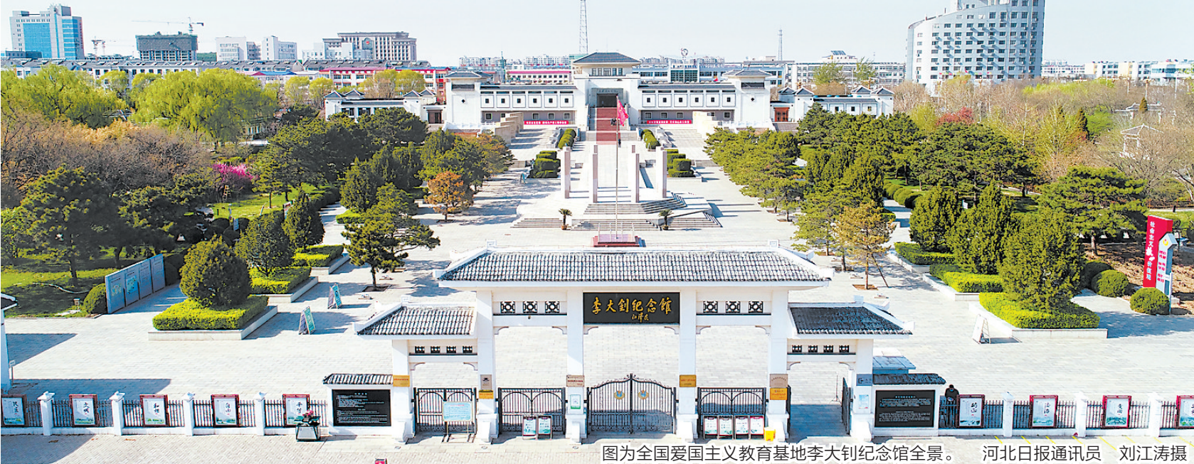
图为全国爱国主义教育基地李大钊纪念馆全景。