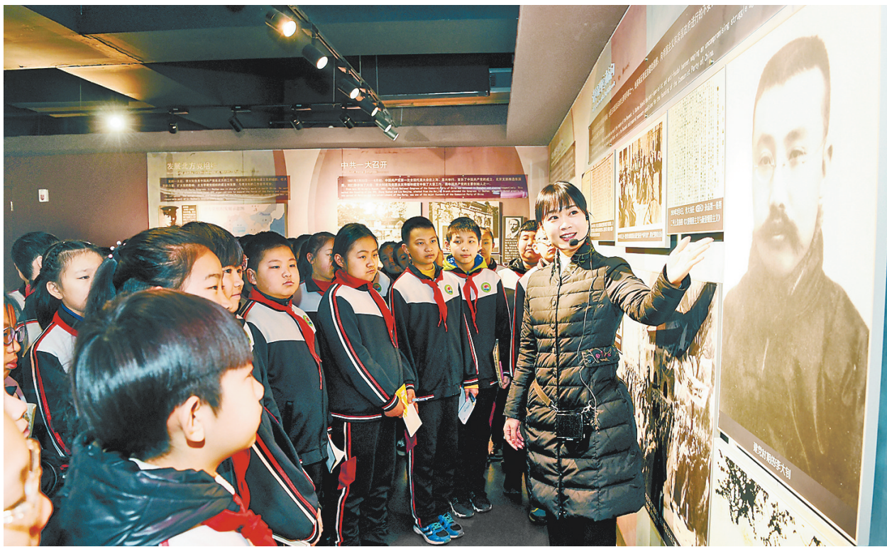
连日来,广大中小学生在李大钊纪念馆聆听先烈革命事迹。