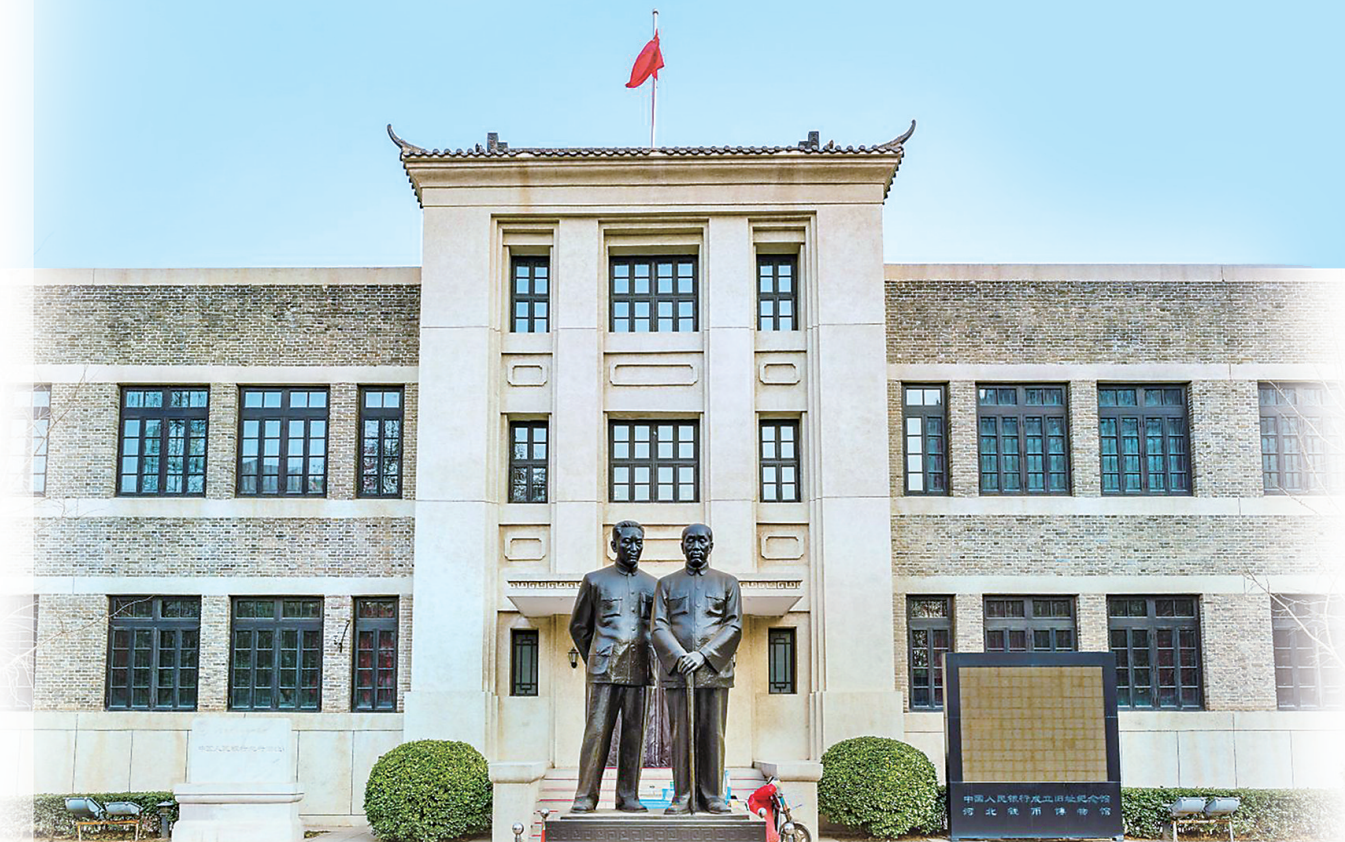
位于石家庄市的华北银行旧址。

华北银行,1948年10月1日在中共中央直接领导下成立,1948年12月1日撤销。