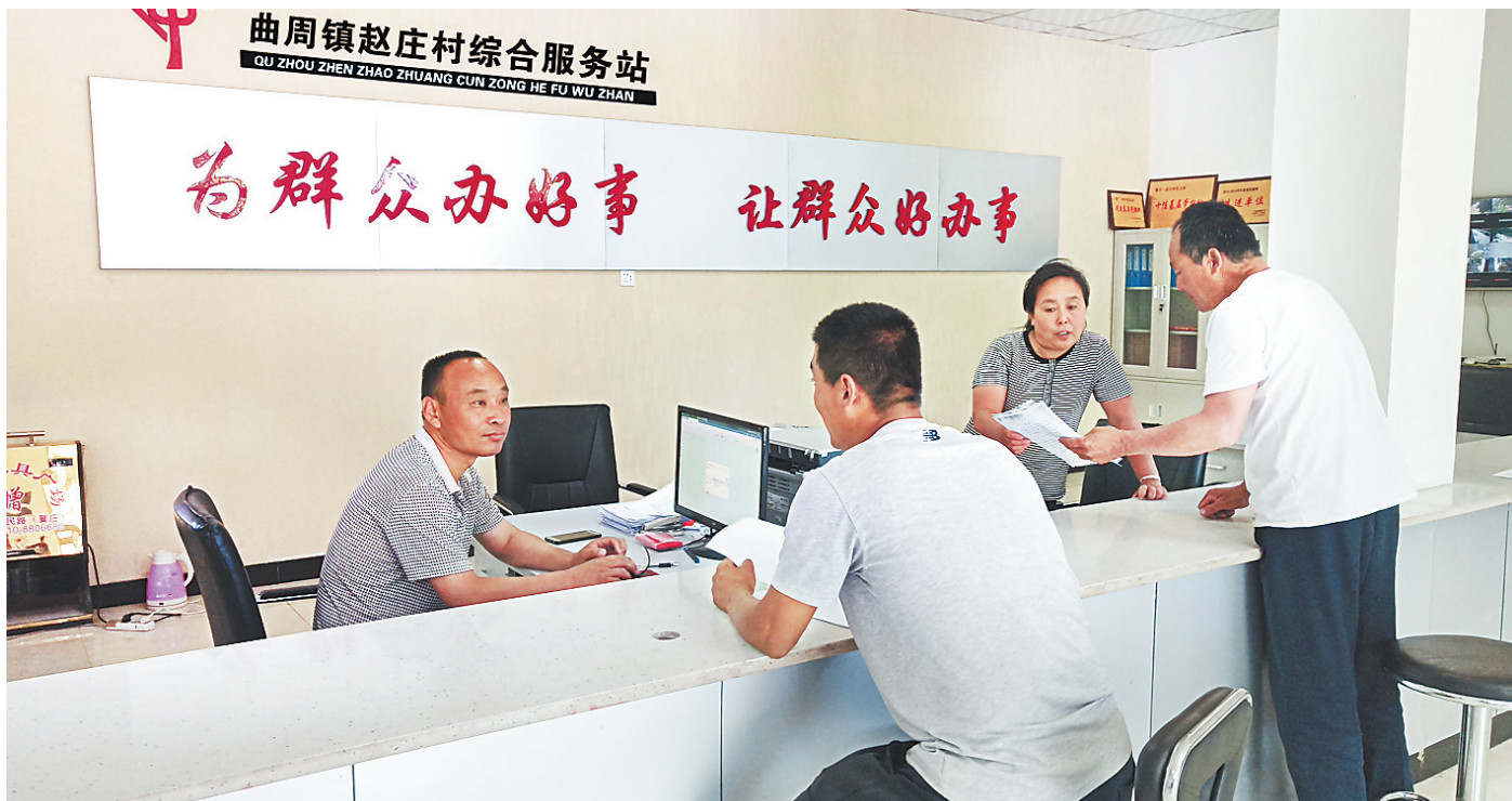
为了服务基层群众,曲周镇赵庄村设立了综合服务站,成为便民利民的“代办服务点”。

去年以来,该县把发展壮大村级集体经济作为提升农村基层党组织组织力和推动乡村振兴的“一把手”工程,坚持因村施策,抱团取暖、多元发展,通过“四种路径”搞活经济。如今,全县100多个村集体经济收入空白村全部“清零”,年收入5万元以上的村由92个增加到302个