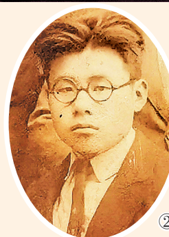
① 史钦琛参加革命后写给母亲的信。 ② 史钦琛烈士肖像照。 ③ 史钦琛家乡——邯郸市亦北村。