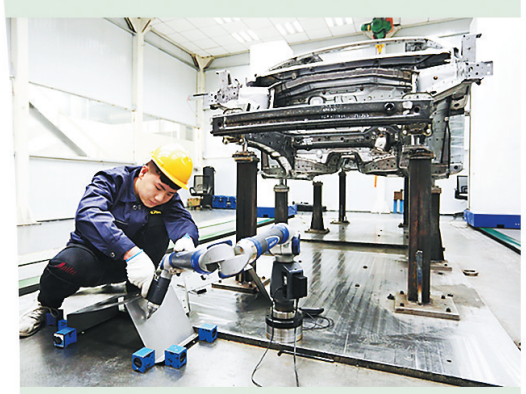
宾法样车试制汽车零部件有限公司样车生产现场。