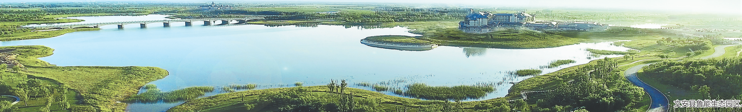
文安县鲁能生态园区。