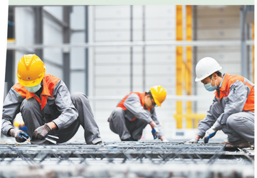
工人们在泰华远大装配式建筑生产车间施工作业。