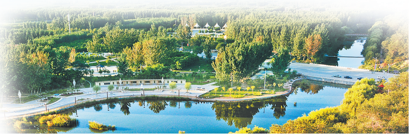
文安县森林公园鸟瞰。

更宽视野、更高标准、更实作风。文安“十四五”时期经济社会发展的主要预期目标更加高远:全县地区生产总值年均增长10%;一般公共预算收入年均增长14.7%;固定资产投资年均增长15%;规模以上工业增加值年均增长17%;全体居民人均可支配收入年均增长10%以上。