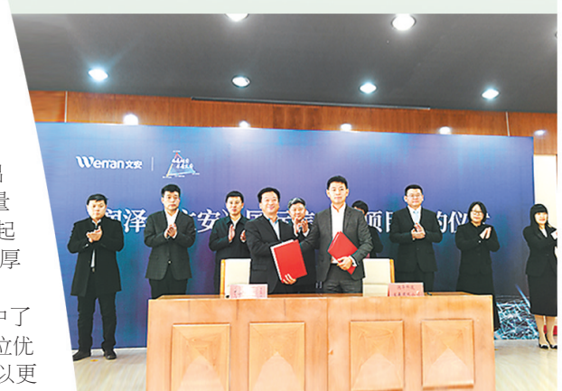
润泽(文安)国际信息港项目签约仪式现场。

驰而不息优化营商环境,文安目前正在制定出台“两个不见面”深化措施,推行工程建设审批实名制、建设项目模拟审批、建设项目先建后验等一系列简政放权措施,推进优化营商环境2.0版,跑出文安发展的服务“加速度”。