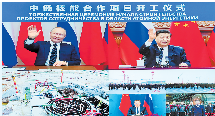
两图均为5月19日下午,国家主席习近平在北京通过视频连线,同俄罗斯总统普京共同见证两国核能合作项目——田湾核电站和徐大堡核电站开工仪式。