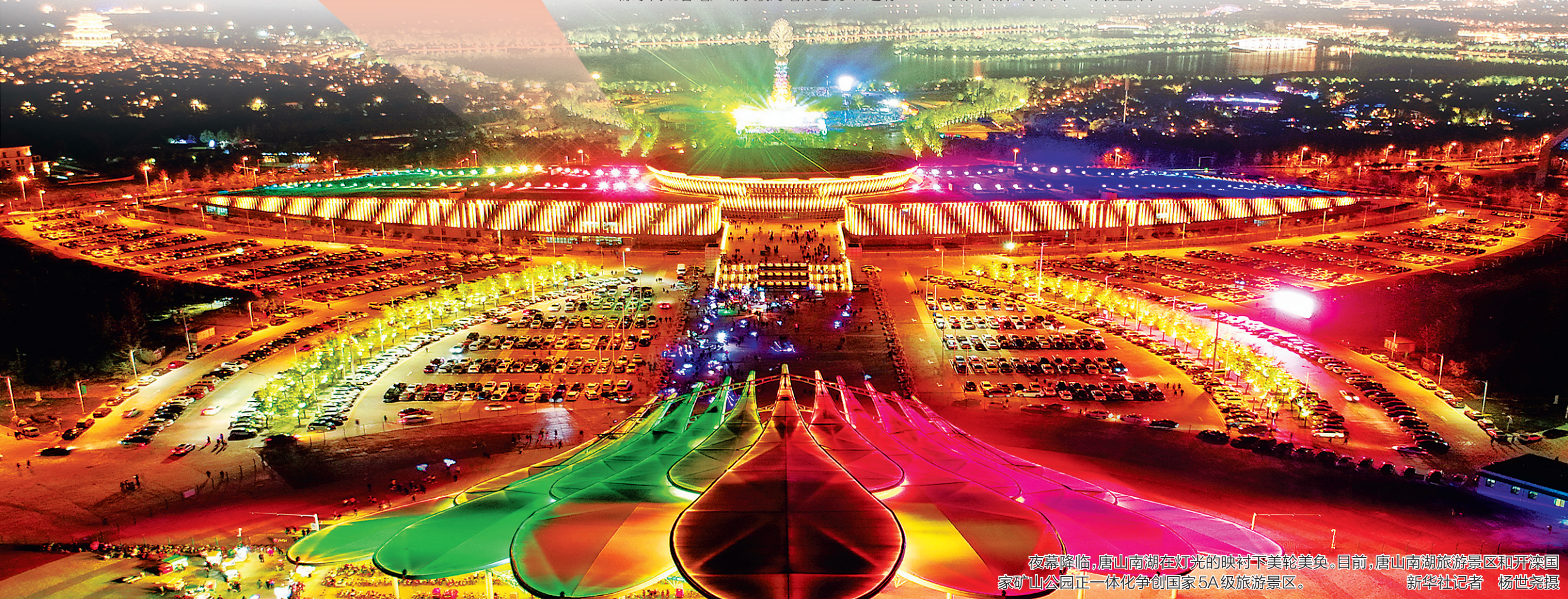
夜幕降临,唐山南湖在灯光的映衬下美轮美奂。目前,唐山南湖旅游景区和开滦国家矿山公园正一体化争创国家5A级旅游景区。