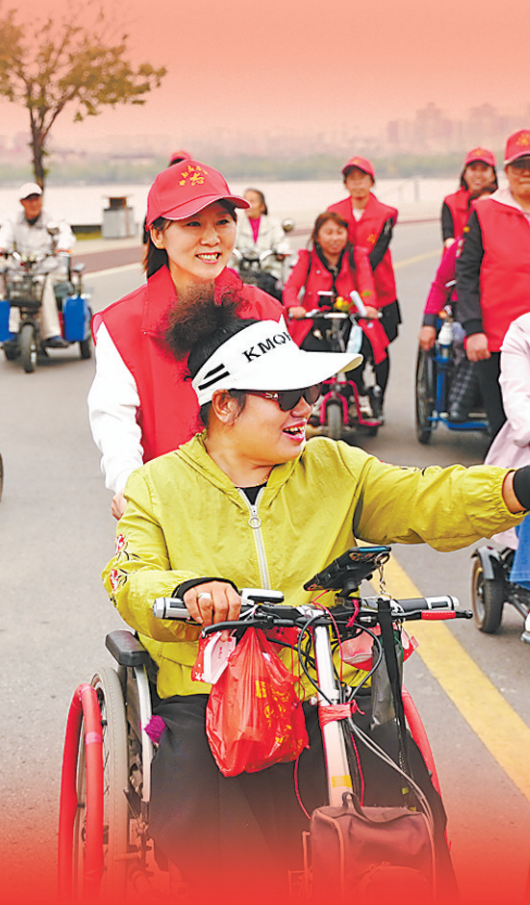
5月16日,唐山市路南区志愿者、爱心人士积极开展扶残、助残爱心活动,让残疾人感受社会温暖,树立生活信心。