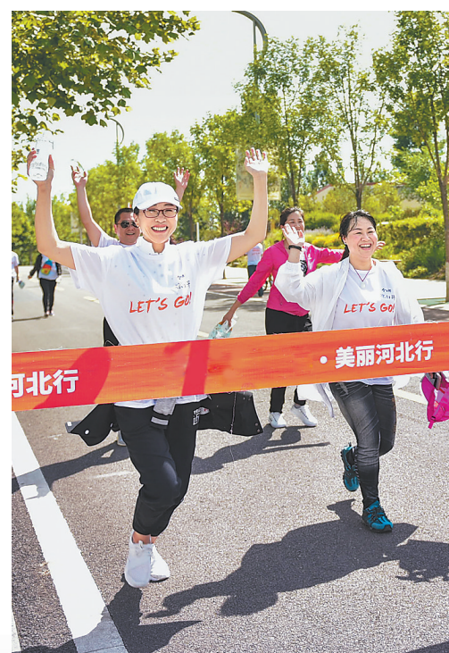
唐山市“第二届万人健步走”活动在南湖公园市民广场举行。