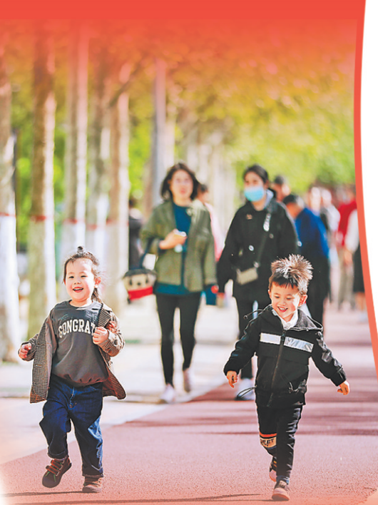
游客在南湖公园享受假日时光。