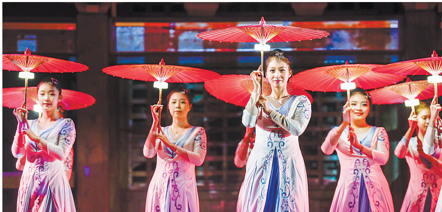
唐山文旅集团打造的国内首部湖中岛上沉浸式实景体验剧《那年芳华》。