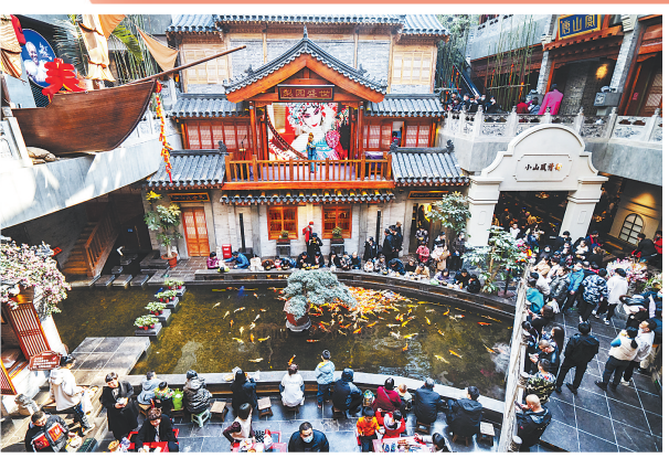
唐山宴饮食博物馆被称为能“吃”的博物馆,并成为了唐山文旅产业兴旺发达的展示窗口。