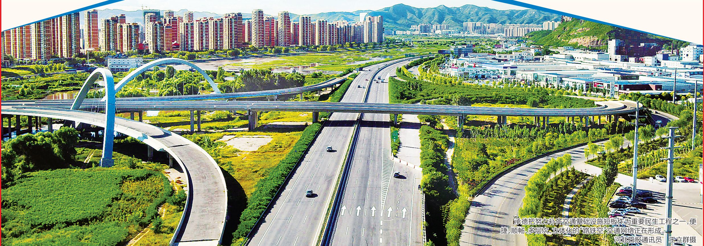
承德把努力补齐交通基础设施短板作为重要民生工程之一，便捷、顺畅、多层次、立体化的“路铁空”交通网络正在形成。