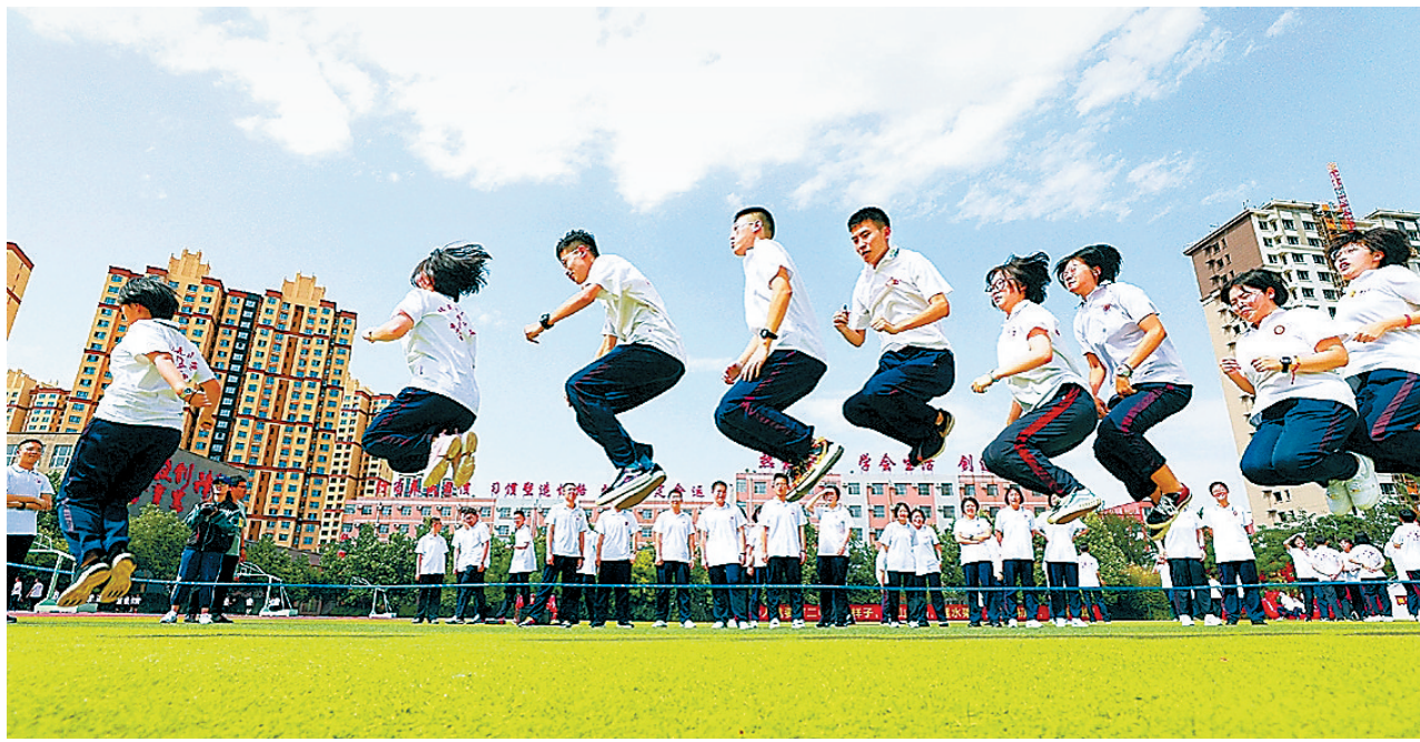
高考临近,衡水市第二中学开展了形式多样的趣味减压活动,帮助学生释放压力、提升自信心,让他们以轻松、乐观、自信的心态迎接高考。图为5月30日该校高三学生在操场上跳绳。

强化疫情防控和卫生防疫。严格落实高考前和高考期间相关学校、考点及周边地区的传染病防控措施,加快教