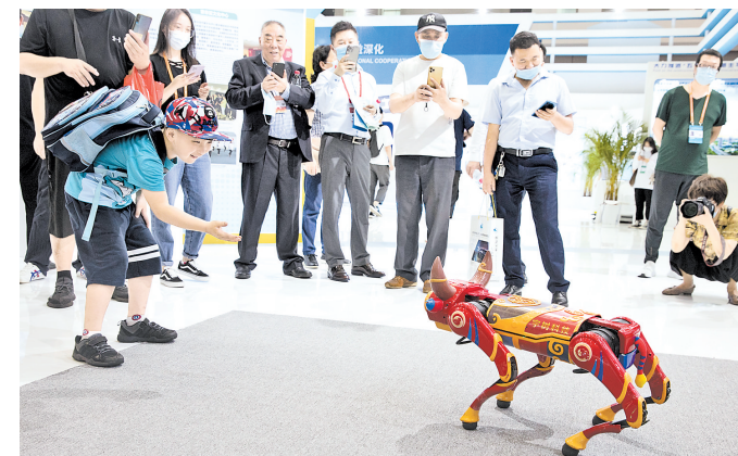
6月9日,在宁波国际会议展览中心,一名儿童被一款机器牛吸引。当日,第二届中国—中东欧国家博览会正式向公众开放。本届博览会设立了中东欧展、国际消费品展和进口商品常年展三大展区,博览会将持续至6月11日。

“我们敦促美方端正心态,理性看待中国发展和中美关系,停止推进有关议案,停止干涉中国内政,以免损害中美关系大局和双方重要领域合作。”汪文斌说。