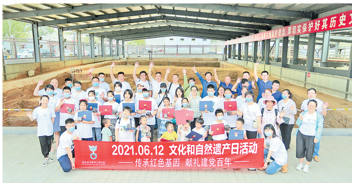
参与公众考古的人们在正定开元寺南遗址合影留念。

烈烈斯民兮,慰汝忠魂。”烈士碑上的诗文,令孩子们动容。砖石无言凝碧血,今天的幸福生活来之不易,繁荣富庶皆因有人负重前行、默默担当。崇拜英雄、敬畏文化的种子,当在今天为孩子们种下。