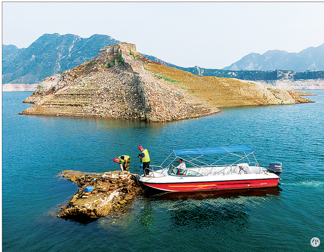
图⑤:工人们把几十公斤重的砖石背运到施工现场。