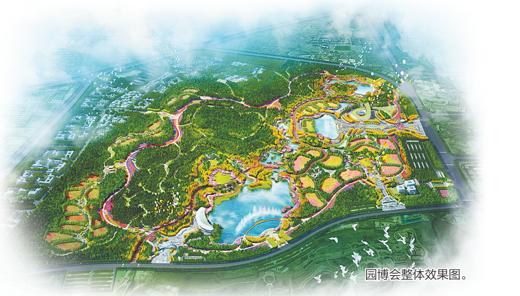
园博会整体效果图。

今年的省园博会,是一场意义重大的盛会。今年是中国共产党成立100周年,是“十四五”开局之年,是开启全面建设社会主义现代化国家新征程的第一年。以省园博会为契机,唐山市委、市政府全面提高政治站位,把做好园博会承办工作作为落实省委、省政府决策部署的重大政治任务,作为推动唐山绿色发展的重要抓手,高标准、高质量、高效率做好各项工作,努力为四海宾朋献上一场群众满意、精彩纷呈、永不落幕的园博会。