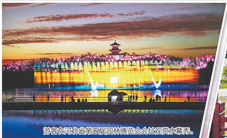
游客在河北省第五届园林博览会会址观赏水幕秀。

在“拆、清”取得阶段性成果的基础上,开平迅速以“治、用”全面推进唐山花海生态修复和转型发展,高标准打造唐山“城市后花园”。