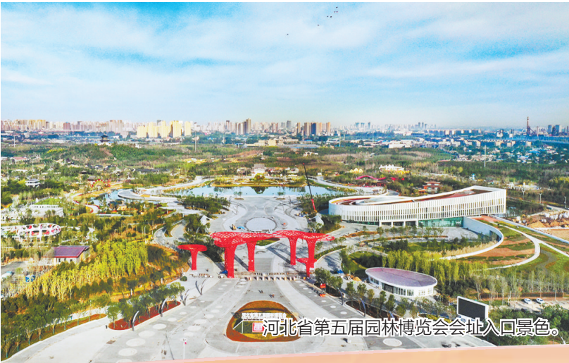
河北省第五届园林博览会会址入口景色。