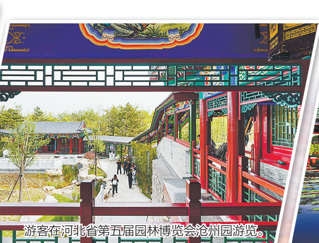
游客在河北省第五届园林博览会沧州园游览。