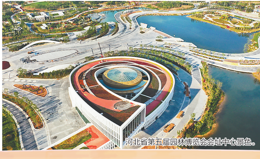
河北省第五届园林博览会会址中心景色。