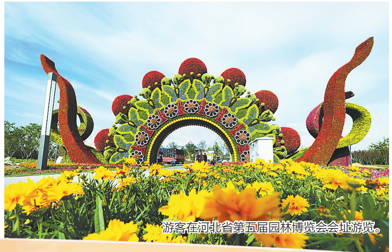
游客在河北省第五届园林博览会会址游览。