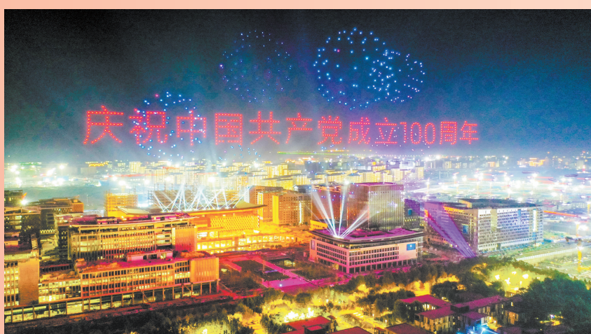
▲7月1日,由1000架无人机组成的“庆祝中国共产党成立100周年”字样闪耀在雄安新区容东片区上空。