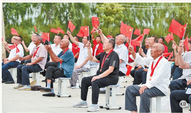
①7月1日上午,西柏坡纪念馆20余名党员和工作人员在九月会议旧址,一起收看庆祝中国共产党成立100周年大会实况。