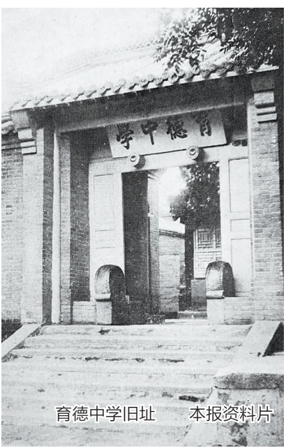
育德中学旧址 本报资料片