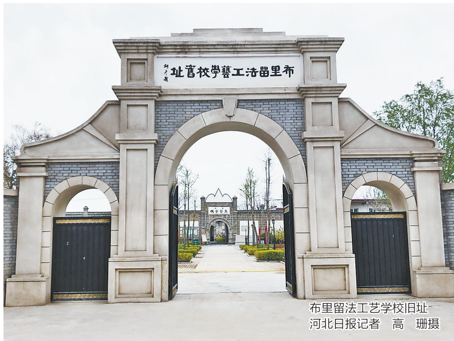
布里留法工艺学校旧址