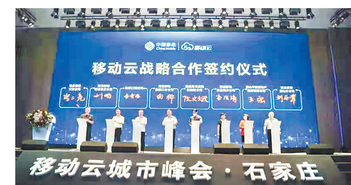
移动云战略合作签约仪式

近年来,我国社会医疗资源分布不均,导致三甲医院人满为患,看病难、看病贵成为群众的烦心事。随着“互联网+”时代的到来,国家大力推进“互联网+医疗”,破解群众就医的关切。