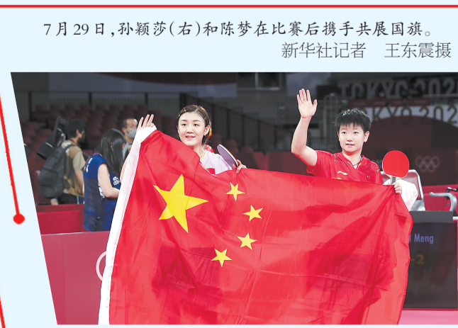
7月29日,孙颖莎(右)和陈梦在比赛后携手共展国旗。新华社记者 王东震摄

河北日报讯(记者张镜)7月29日,在东京奥运会女子4×200米自由泳接力决赛中,我省运动员李冰洁与国家队友发挥出色,合力摘得金牌,并创造了该项目新的世界纪录。我省运动员孙颖莎则在乒乓球女子单打决赛中夺得银牌。同为“00后”的我省运动员李冰洁、张雨霏和孙颖莎都是首次参加奥运会。