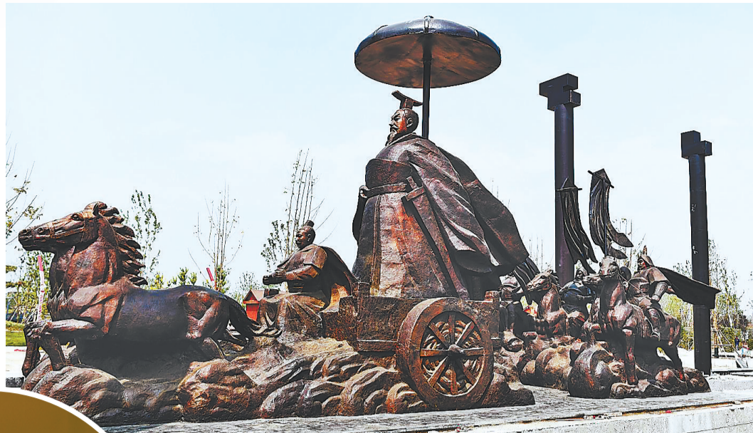
▲邢台园博园祖乙迁邢雕塑。 ▲台西遗址出土的我国迄今年代最早的铁器铁刀铜钺。

原来这是一件陶器的上下两部分。他兴奋得差点跳起来,继续!很快,按照这个办法,又有好几对陶罐和陶鬲“配对”成功。