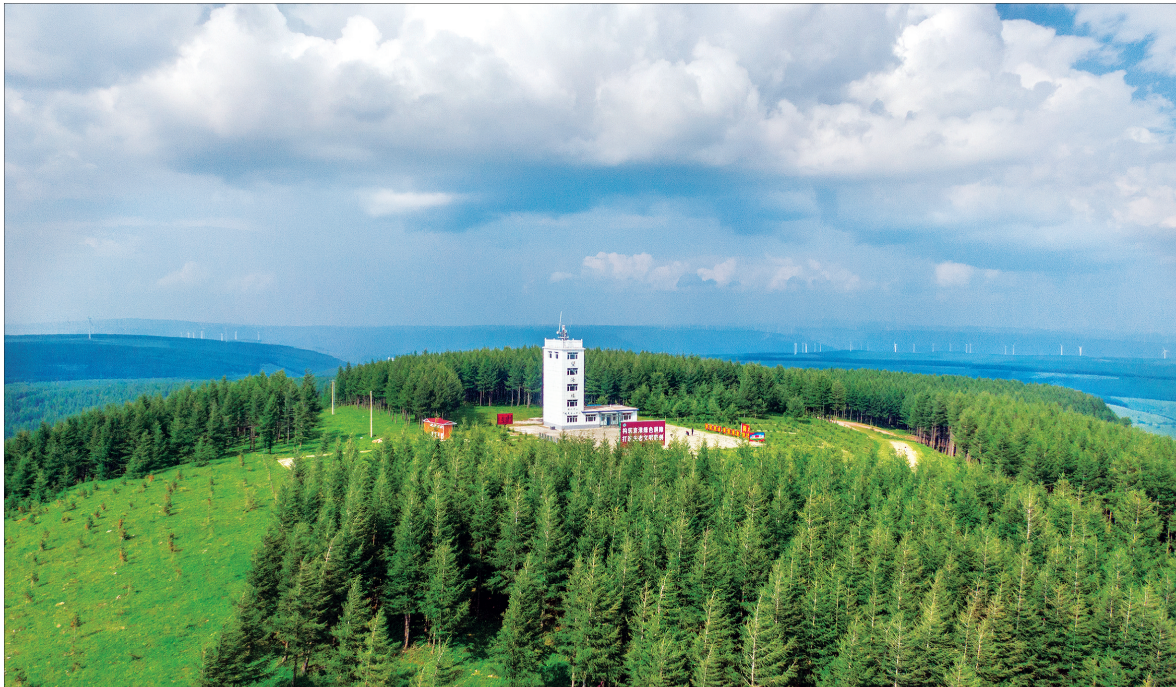
望海楼如卫士一般矗立在塞罕坝林中。