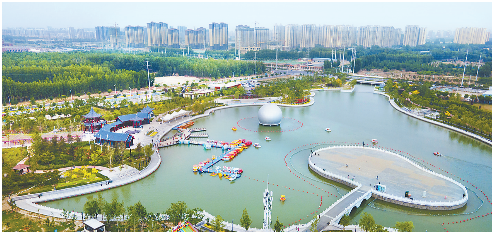
近日,市民在安次区御龙河公园休闲游玩。安次区以“保持生态平衡,创建环境水系”为目标,投资4.6亿元实施御龙河生态环境修复工程,建设集休闲与景观相结合、功能与生态于一体的御龙河公园,使多年的“臭水沟”变成了景观河。