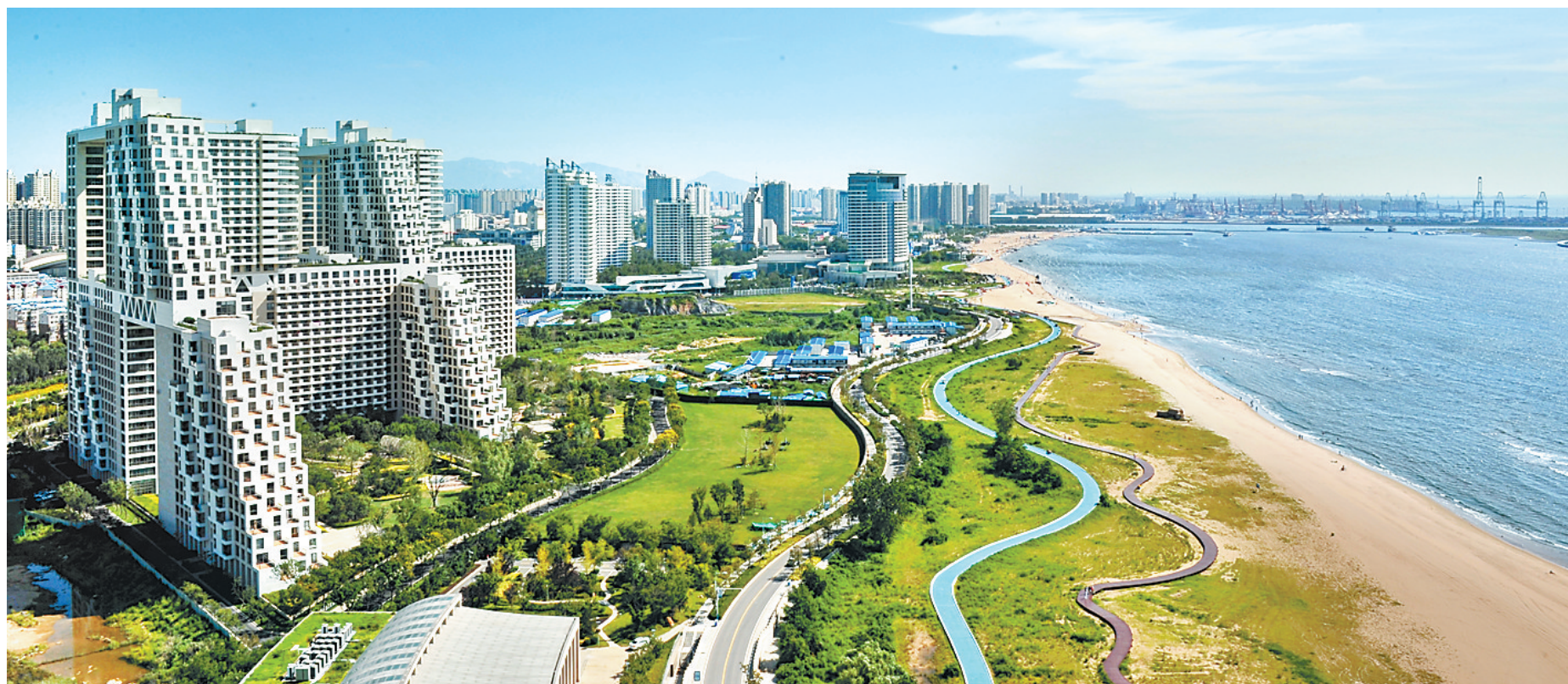
秦皇岛市金梦海湾。

“加快优化经济结构和提质增效,加快发展城市经济、县域经济、民营经济、数字经济和海洋经济,加快推进治理体系和治理能力现代化,实现经济行稳致远、社会安定和谐,努力打造环境优美、产业繁荣、文明健康、安全舒适的一流国际旅游城市,奋力开创新时代全面建设社会主义现代化国际沿海强市、美丽港城新局面,在全面建成社会主义现代化强国的新征程上谱写秦皇岛精彩篇章。”8月21日至23日,中国共产党秦皇岛市第十三次代表大会召开,站在改革发展新的历史起点上,全面擘画了未来5年的宏伟蓝图和战略举措,确定了建设一流国际旅游城市的宏伟目标。