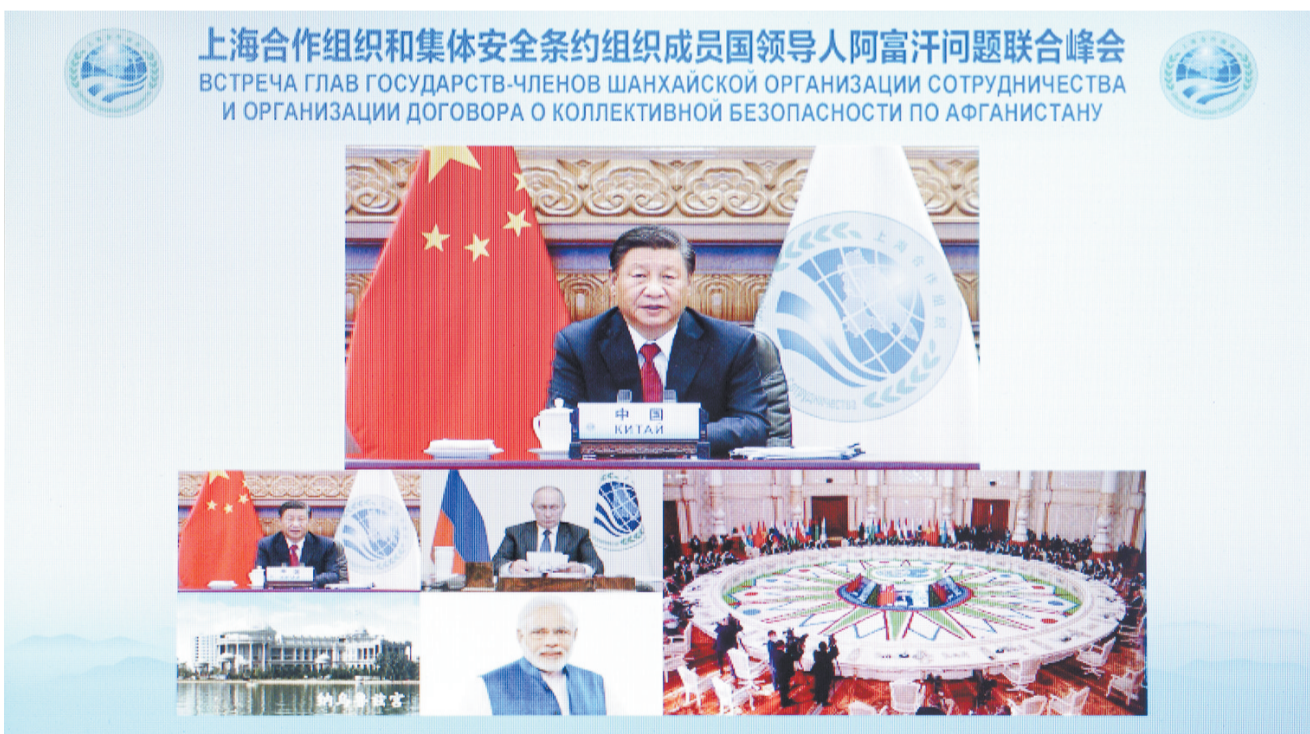
上海合作组织和集体安全条约组织成员国领导人阿富汗问题联合峰会 ВСТРЕЧА ГЛАВ ГОСУДАРСТВ ЧЛЕНОВ ШАНХАЙСКОЙ ОРГАНИЗАЦИИ СОТРУДНИЧЕСТВА И ОРГАНИЗАЦИИ ДОГОВОРА О КОЛЛЕКТИВНОЙ БЕЗОПАСНОСТИ ПО АФГАНИСТАНУ

新华社北京9月17日电 国家主席习近平17日下午在北京以视频方式出席上海合作组织和集体安全条约组织成员国领导人阿富汗问题联合峰会并发表重要讲话。