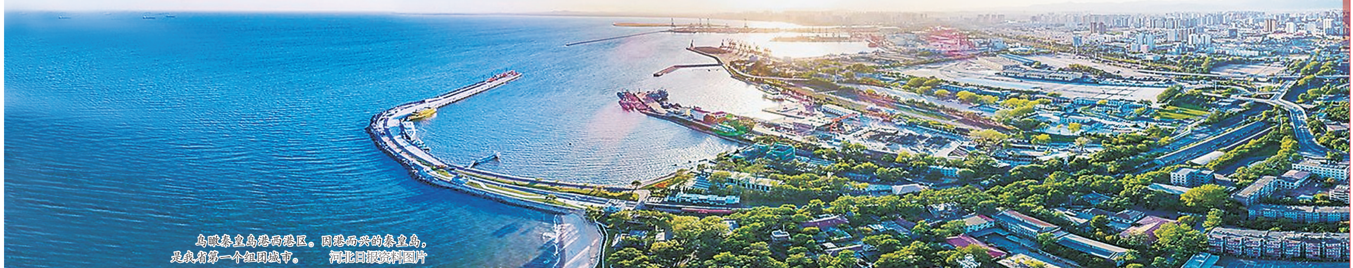
鸟瞰秦皇岛港港区。因港而兴的秦皇岛,是我省第一个组团城市。