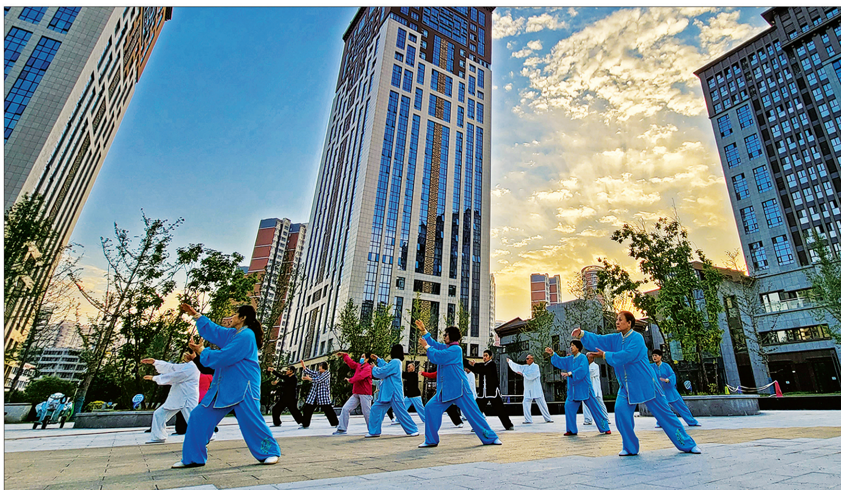
左图:社区老人的幸福生活。