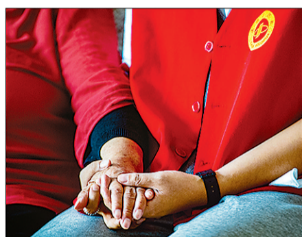
右图:志愿者在社区开设的老年食堂为老人贴心服务。