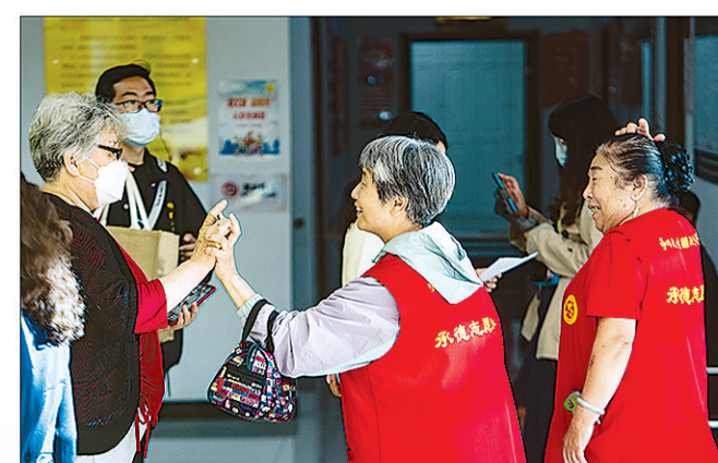
上图:随着“时间银行”知名度的提升,志愿者队伍也在不断壮大。