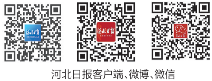
河北日报客户端、微博、微信