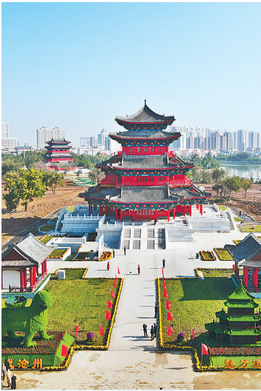
▲南川楼(前)、朗吟楼(后)盛装迎宾客。 ▶10月9日，演员在吴桥县江湖大剧院表演杂技节目。

沧州市按照“河为线、城为珠，线串珠、珠带面”的理念，全面做好保护、传承、利用三篇文章，加快推进以中国大运河非遗文化公园为标志的重点工程建设，统筹构建了全域“1+6+1”规划体系，努力打造大运河璀璨文化带、绿色生态带、缤纷旅游带