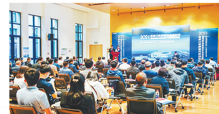
2021年张家口市“质量月”启动仪式暨重点区域质量提升现场观摩活动。

省产品质量监督检验研究院所属国家体育用品质量监督检验中心在张家口设立了我国首个冰雪产业实验室,有力促进冰雪产业高质量发展。今年“质量月”期间,省、市市场监管局共同组织省级技术机构、专家团队深入张家口市两个冰雪运动装备制造基地,调研冰雪装备产业的发展现状和态势、企业的生产能力,对标对表国际知名企业和国内一流企业,推进冰雪产业全链条高水平发展。目前,张家口实现了从大到小、从个人到场地、轻重装备结合、研发制造销售服务、运动体验会展全覆盖的冰雪运动装备全产业链布局,发布了全国首个张家口·中国冰雪产业发展指数,冰雪产业与互联网、大数据加速融合发