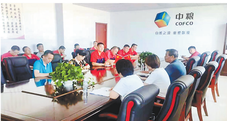
组织专家组对中小企业QC小组、质量信得过班组组建等工作开展现场指导帮扶。