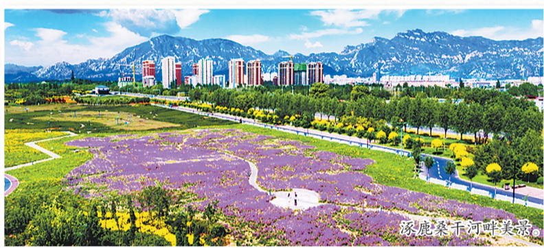
涿鹿桑干河畔美景。

抓好“增绿”工程,擦亮生态底色。作为毗邻京津的重要生态功能区,涿鹿坚持把造林绿化作为推进首都“两区”建设的重要抓手,高质高效