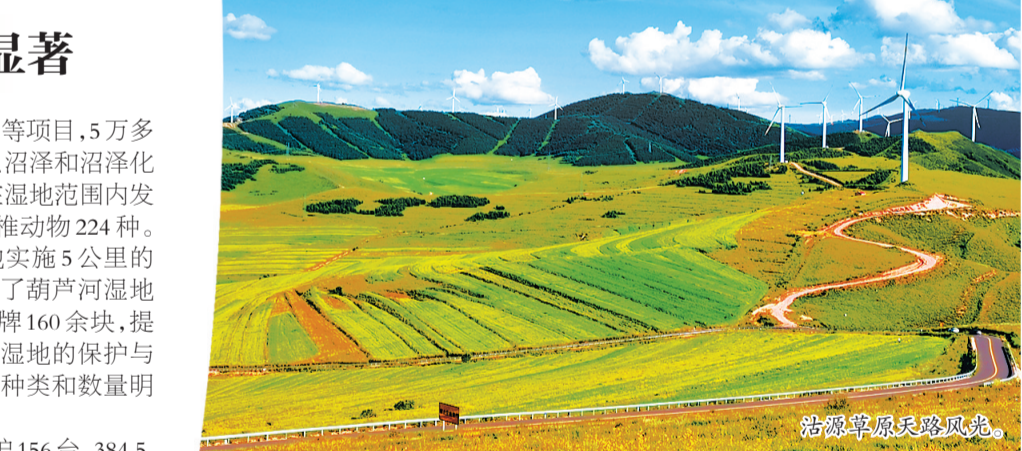
沽源草原天路风光。

党的十九大以来,沽源县坚持“统筹山水林田湖草系统治理”的生态理念,以提高林木绿化率和森林覆盖率、构建稳定生态系统为目标,高标准实施人工造林、封山育林和森林质量精准提升,统筹推进生态建设、新型城镇化和绿色产业发展,为加快绿色发展、建设生态强县提供了强有力的生态支撑。 该县累计完成造林绿化107.4万亩、休耕种草46万亩、草场治理13.7万亩,治理水土流失面积131.9平方公里。先后荣获“三北二期工程建设先进单位”“首都周围绿化银杯奖”“河北省林业工作先进集体”“张家口市2016年春季造林绿化工作先进集体”等荣誉。 通过实施自然保护地整合优化、葫芦